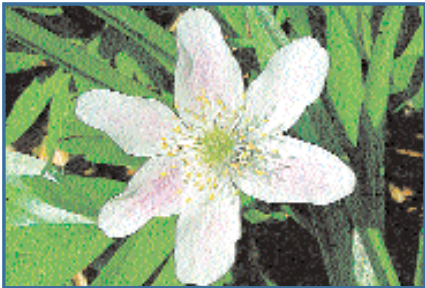
Sie stehen unter ständiger Beobachtung, weil sie Rückschlüsse auf die Klimaveränderung erlauben: Lärche (oben), Buschwindröschen, Rosskastanie